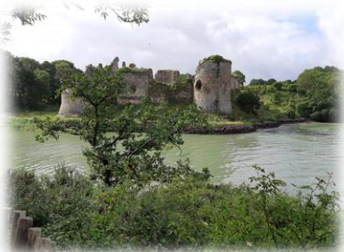
Château du Guildo

L’objet de cette première newsletter est donc de recréer du lien entre notre maison d’accueil de Créhen et vous – familles, religieux, mouvements d’Eglise, associations de tous types, – qui avez séjourné chez nous ou envisagez de le faire. Il s’agit également de vous donner de nos nouvelles, de vous informer des travaux réalisés au cours de cette année 2020, si atypique, et de vous associer à nos projets, de vous inviter enfin à nous rejoindre au gré de vos pérégrinations bretonnes ou de vos perspectives de réunions ou de sessions “