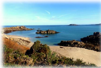
Saint-Jacut de la Mer