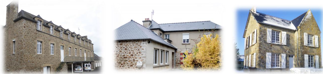
Février 2021 - Quelques photos sous la neige !

Durant cette période, difficile à tous égards, salariés et sœurs sont parvenus à se préserver du virus, tout en maintenant une bonne qualité de service et en investissant dans la rénovation et l'amélioration des locaux d'accueil au profit des séjours ...à venir.